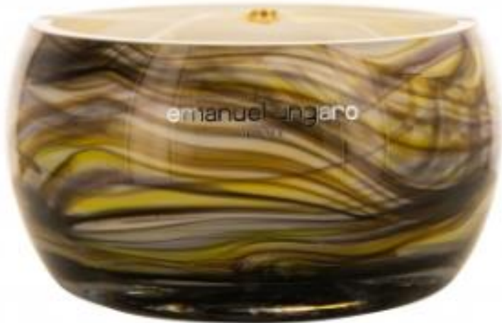
Black Eyed Ecorce Rouge