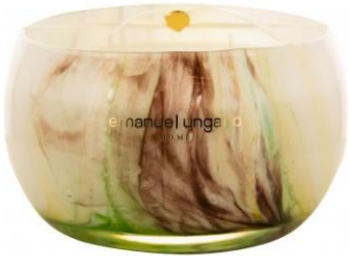
Tormalina Agrumes Bourbon

Fibra di vetro HB 19,5 x 19,5 x 11,0cm Peso: 185ogr