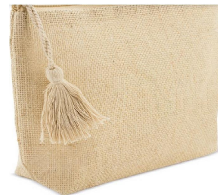
Tirazip Pon-pon 25 x 16,50 x 6cm

3 colori Ecrú (arrivo 04maggio) Rosso e Nero