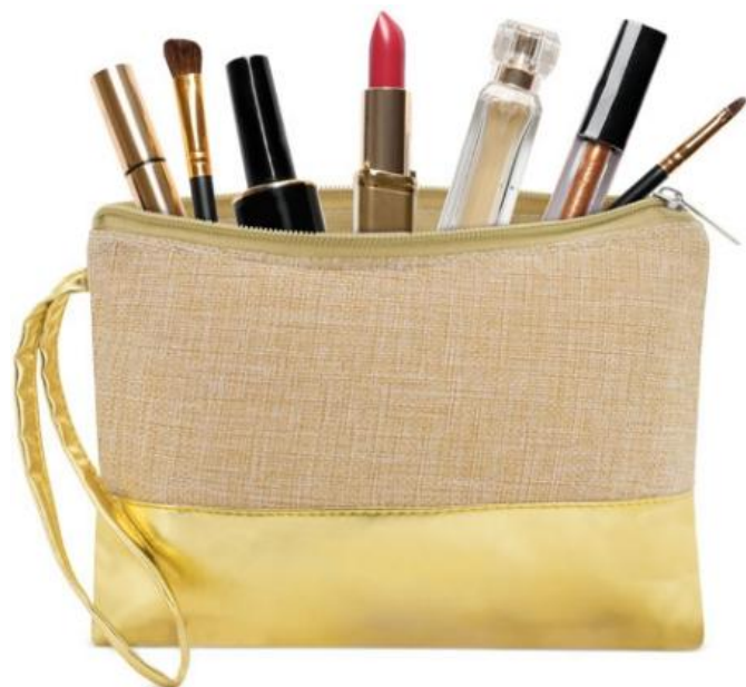
Juta e Similpelle laminata

Pratica ed elegante borsa cosmetica. Maniglia in similpelle e cerniera metallo Deluxe. 22,50 x 18.00