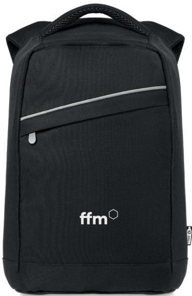
Modello B Porta p.c.

Personalizzabile serigrafia max 4 col. 19 x 15cm Transfer serigraf. o digitale max 8 col.