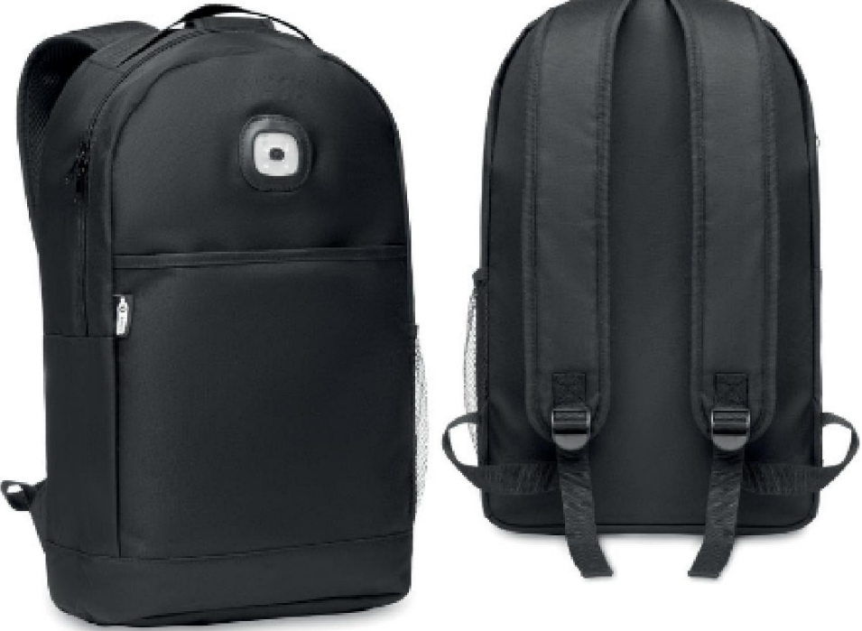
Modello A Luce COB

Luce Cob Bianca removibile, con 3 diversi livelli di luminosità Vano centrale, tasca frontale con chiusura in velcro. Tasca laterale a rete. Batterie a bottone incluse.